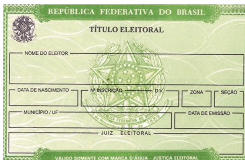
TÍTULO DE ELEITOR