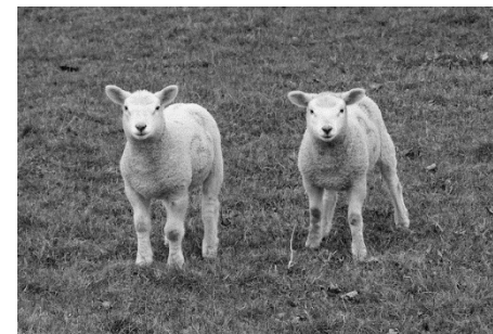
Chance Reuben K Sam/pexels